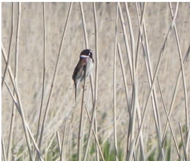
Rørspurv Bassin 3.