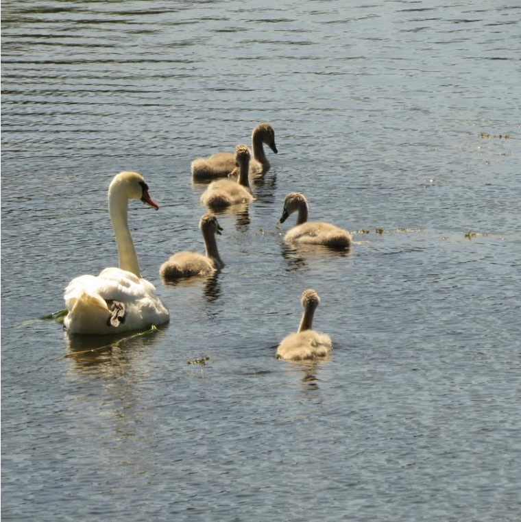
Knopsvane med 5 unger bassin 10