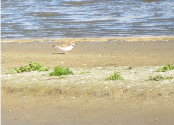
Lille Præstkrave i Bassin 7.