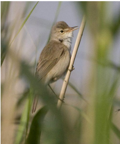
Rørsanger Bassin 9.