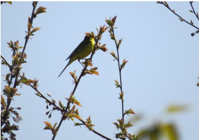
Gul Vipstjert ved Bassin 8.

Bassin 4: 1 par. Bassin 13: 1 par. Bassin 15: 1 par. Nordhegnet: 1 par.