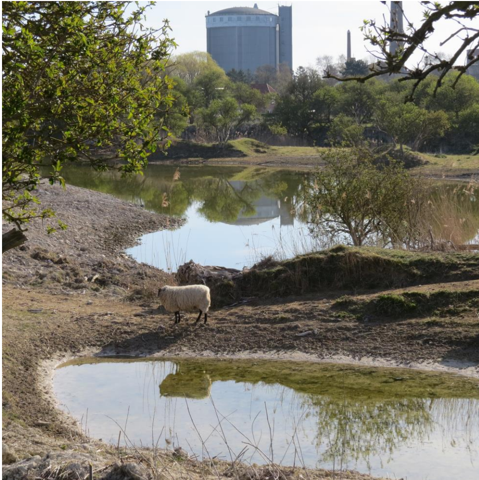
Bassin 16 i maj efter reovering.

Vordingborg kommune Afdeling for Byg, Land og Miljø