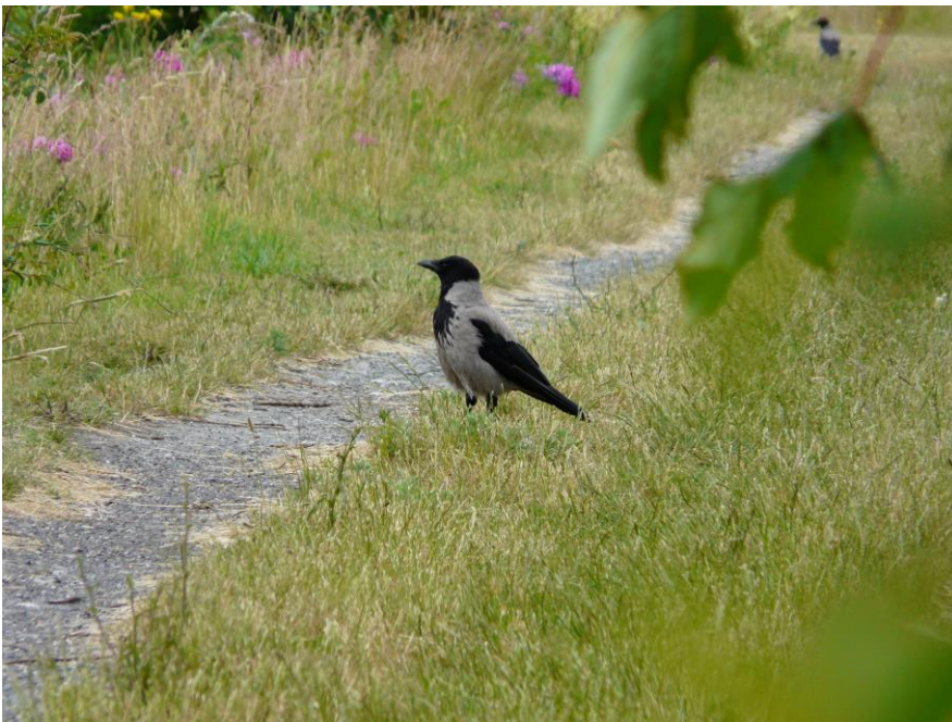
Gråkrage ved Sydhegnet.

Ikke ynglende i bassinerne denne sæson, men ofte set fouragerende ved bassinerne.