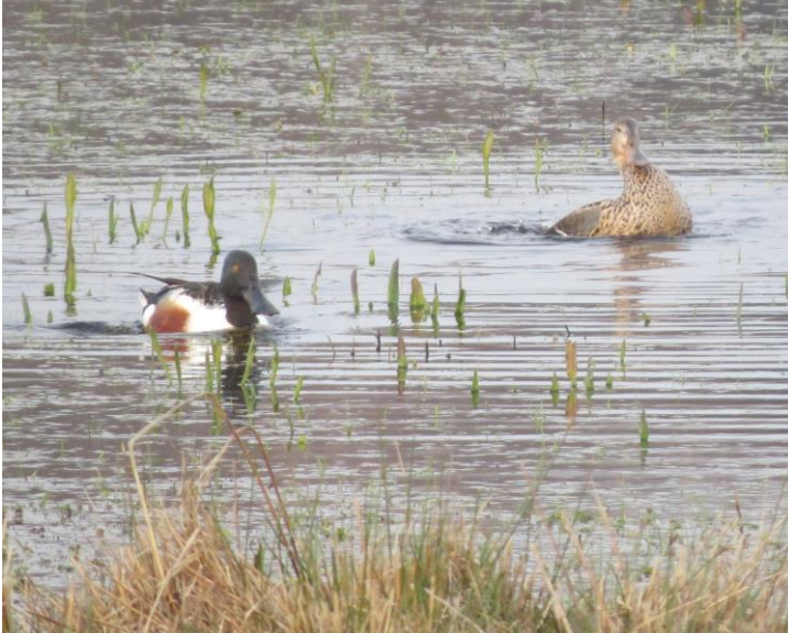
Skeandepar i bassin 7.