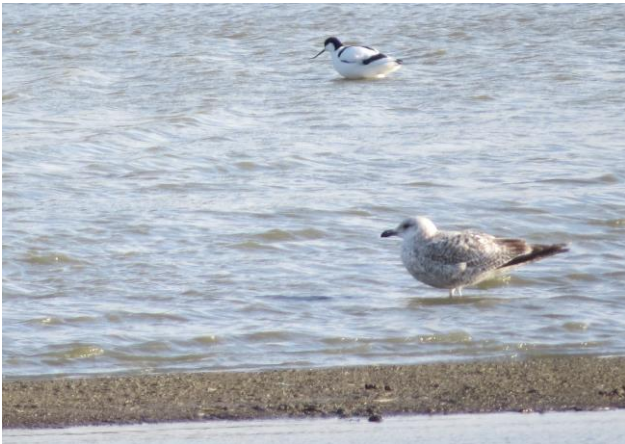
Klyde i Bassin 7.

Et par opholdt sig i Bassin 6 fra 2.-10. maj.