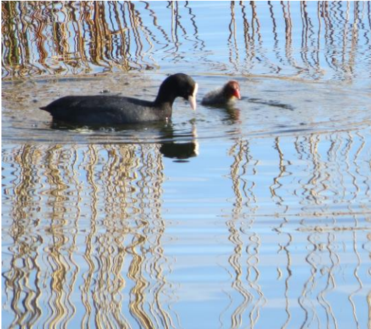
Blishøne med unge Bassin 10.