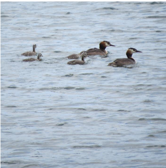
Toppet lappedykker med 4 unger bassin 9