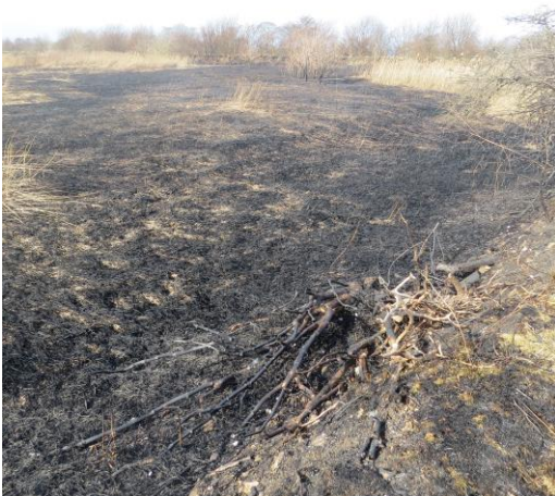
Et overraskende syn 3. marts.

Der mangler lidt orientering i forbindelse med større indgreb i bassinerne, da mange besøgende, som kender mig, forventer at jeg ved, hvorfor der er afbrændt partier eller lavet udgravninger i området. En lille mail ville give mig forhåndskendskab til aktiviteterne.