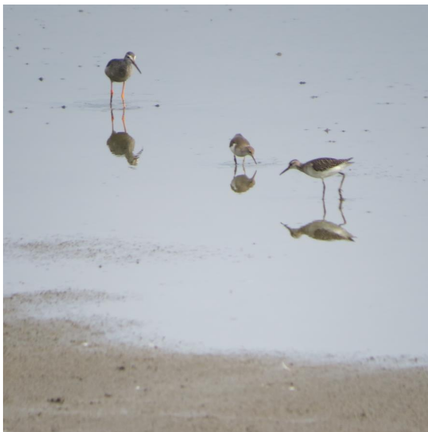
Vadefugle i det lavvandede Bassin 7.

Bassinerne 2, 4, 5 og 6 fremtræder mere og mere som afgræssede flader med spredt busk- og træbevoksning. Der mangler dog tornede krat for at opfylde krav til overdrevsbiotop.