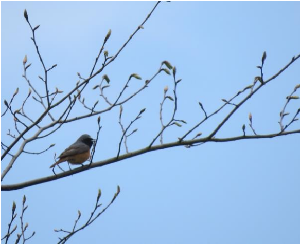
Rødstjert Bassin 7.

Bassin 7: 1 par. Bassin 15: 1 par. Sydhegnet: 1 par.