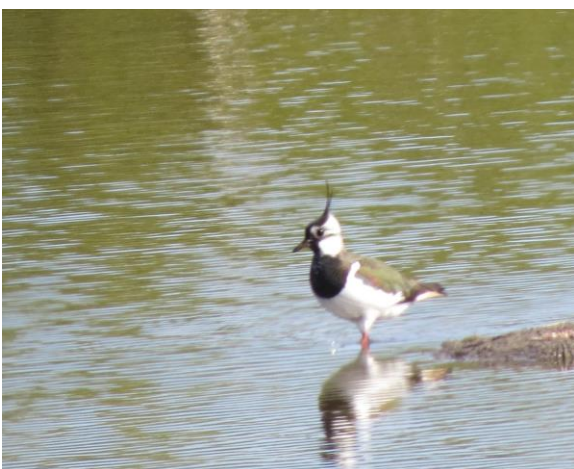
Vibe i Bassin 7.

2 par i bassin 6, 1 par i bassin 7. Kun parret i bassin 7 set med 1 unge.