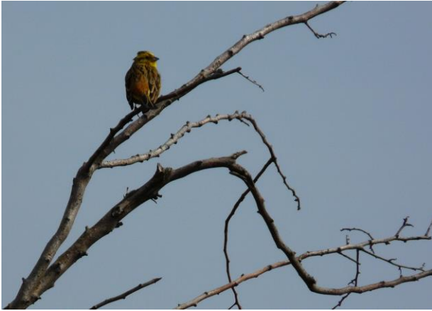
Gulspurv Bassin 2.